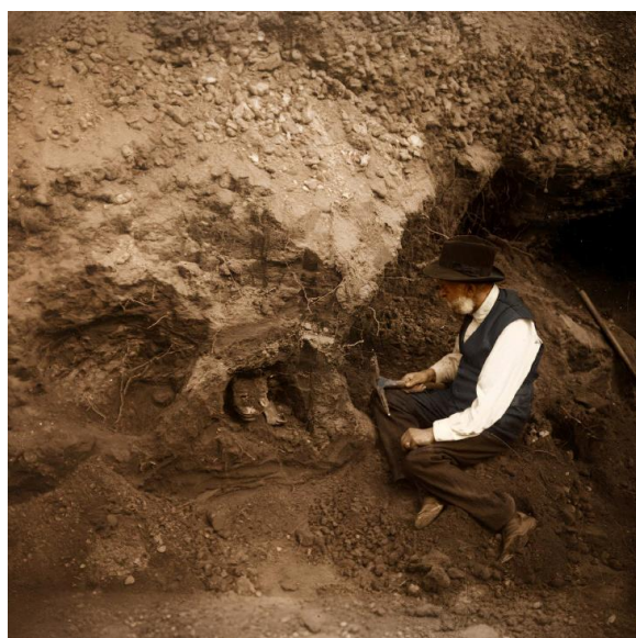
Emile Cartailhac fouillant une tombe dans la nécropole d'Ensérune en 1916. Image colorisée.

Les méthodes et les techniques de l'archéologie au début du XX e siècle évoluent ainsi considérablement. L'apparition de la photographie à la fin du XIX e siècle joue un rôle fondamental notamment pour la documentation, l'inventaire et la diffusion des connaissances.