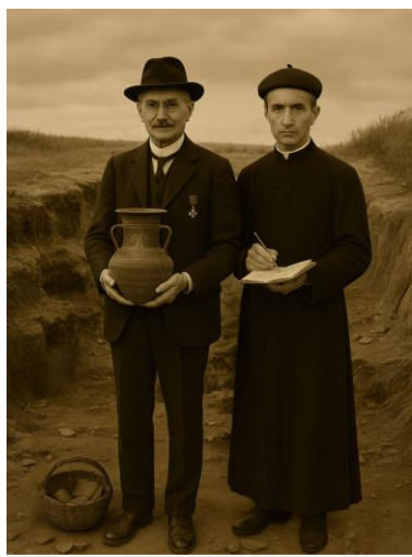
Portrait en pied de Félix Mouret et de l'abbé Sigal, pionniers majeurs dans l'étude de l'oppidum d'Ensérune de 1915 à 1945. Image réalisée par IA.

Des reconstitutions sonores de moments clés proposent des témoignages vivants : l'arrivée solennelle de l'Académie des Inscriptions et Belles-Lettres, le projet de création d'un musée Injalbert-Mouret à Béziers... jamais réalisé, ou encore la vente de la propriété Maux à l'État.