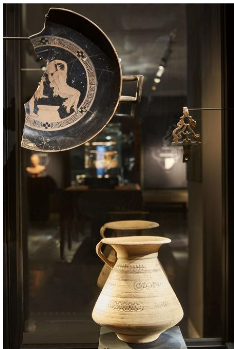
Coupe grec, vase ibérique et boucle de ceinture celtique découverts dans la tombe IB38 de l'oppidum d'Ensérune. Vers 400-375 avant J.-C.