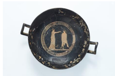
Coupe attique à tige à figures rouges dite coupe de Procris et Céphale découverte sur l'oppidum d'Ensérune.

Des films et podcasts de chercheurs investis à Ensérune mais également au niveau national permettront aux visiteurs de mieux comprendre comment les populations de l'oppidum ont adopté une partie de la culture grecque et l'ont intégré à leur propre mode de vie et de pensée.