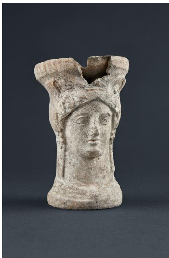
Brûle-parfum (thymiaterion) fabriqué dans les ateliers grecs de la côte catalane découvert sur l'oppidum d'Ensérune. II e s. avant J.C.