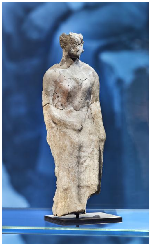
Figurine de femme ou déesse assise découverte dans la tombe IB 128 de la nécropole d'Ensérune. Vers 400-350 avant J.-C.