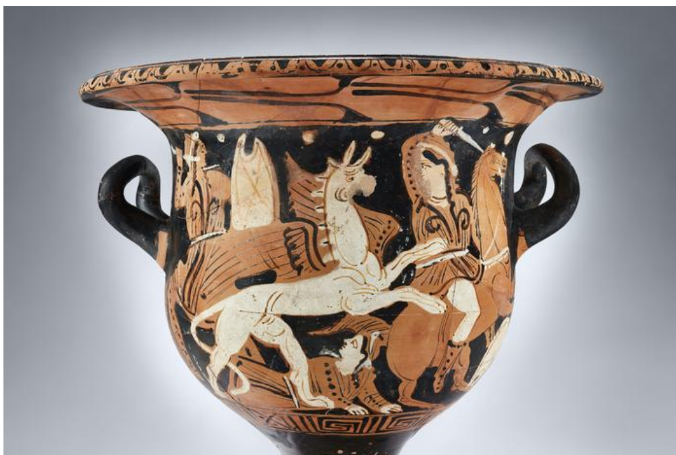
Cratère grec au décor de griffons et d'Amazones découvert dans la tombe GR04 de l'oppidum d'Ensérune. Vers 375-350 avant J.-C.