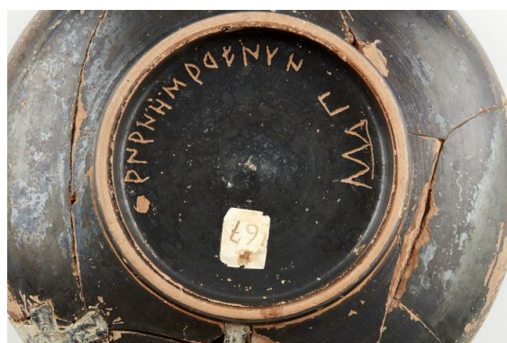
Détail d'une coupe en céramique attique à vernis noir portant des graffites ibères et une marque en chiffres grecs, découverte sur l'oppidum d'Ensérune.

L'exposition « Comme un air venu d'Athènes » propose de découvrir comment ces influences ont accompagné le quotidien des populations d'Ensérune et contribué à façonner une culture originale, au carrefour des mondes grec, ibère et gaulois.