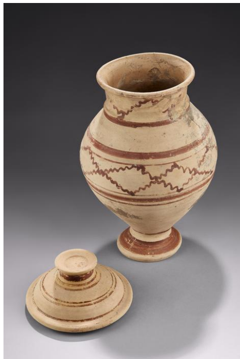
Vase en céramique claire héraultaise, imitant des décors méditerranéens, découvert dans la tombe IB62 de la nécropole de l'oppidum d'Ensérune. Vers 375-325 avant J.-C.